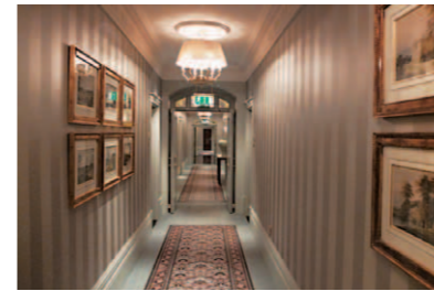
歴史の重みを感じさせ重厚な雰囲気漂う客室廊下