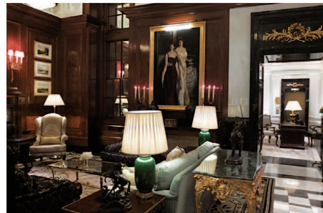
巨大な絵画が掛けられているゴージャスなロビーラウンジのコーナー。右手奥の部屋がレセプションルームになっている