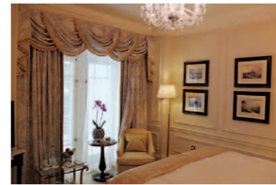
ドレープカーテンが美しいベッドルームのシッティングエリア