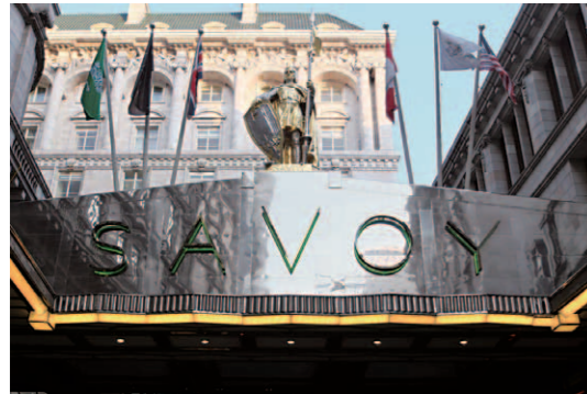
ザ・サヴォイの象徴であるサヴォイ伯ピーターの黄金像が、頭上からその圧倒的存在感を放つ