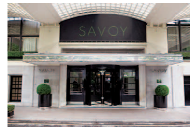
テムズ川公園側に新装なったモダンスタイルのリバーサイド・エントランス