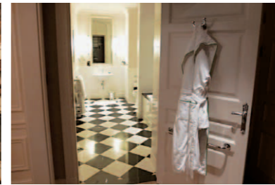
玄関ホワイエから俯瞰したアールデコ調のクラシカルなバスルーム