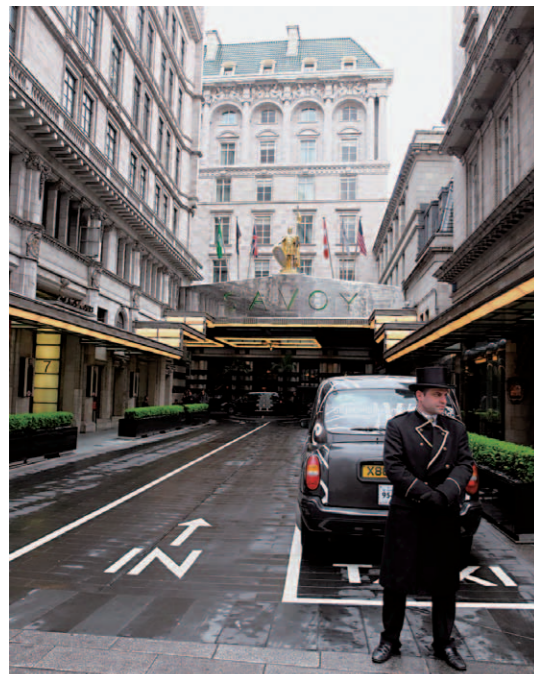
ストランド大通りから奥に延びるエントランスアプローチ「Savoy Court」。右手にホテル発祥の地であるサヴォイ劇場が見える