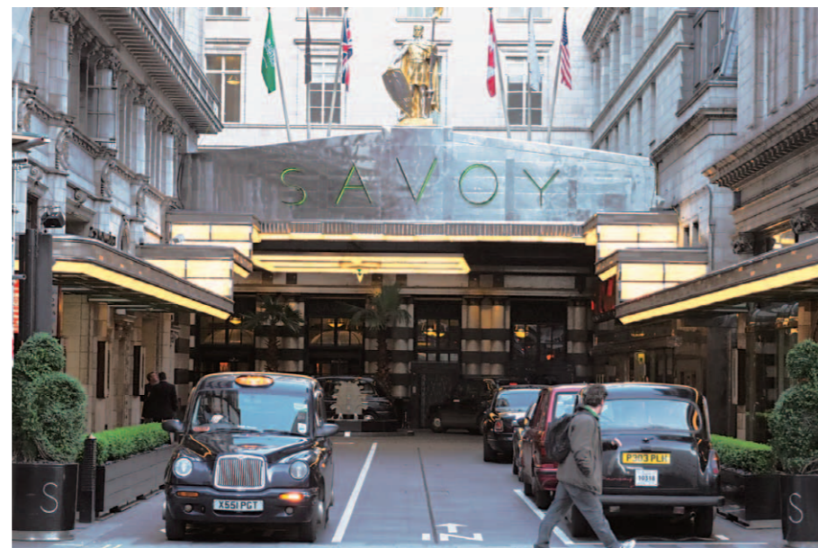
ザ・サヴォイの代表的な光景である「Savoy Court」から望む正面ファサード。イギリス国内で唯一の「右側通行の道路」といわれている不思議な空間でもある