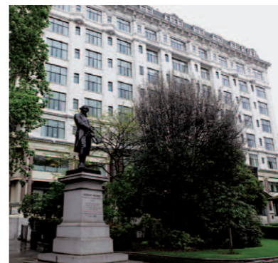
テムズ川沿いに広がるビクトリア・エンバクメント公園側から俯瞰したリバーサイドビューの建物

“The Savoy”、すべてはこのホテルから始まった。サヴォイ伯ピーターの黄金像が圧倒的存在感を放つ、ザ・サヴォイのエントランス・アプローチ右手にサヴォイ劇場がある。この劇場こそがサヴォイの原点であり、劇場のオーナー兼興行主で「ギルバート・アンド・サリバン・オペラ」の創始者であるリチャード・ドイリー・カートが、1889年に開業したホテルがザ・サヴォイである。進取の気性に富むカートは、視察に出かけたニューヨークを始めとしてアメリカ滞在中に体験した先進的なホテルとレストランを、ロンドン社交界に持ち込むことを決意する。当時の英国上流社会はホテルを社交の場とするコンセプトが無く、ホテルはあくまで旅先の宿泊施設であり、外食も男性だけの所業とされていた時代であった。野心に燃えるカートはさっそくホテル建設に取り掛かり、バスルーム付き客室、エレベーター、世界初の防火床、自家発電など当時の最先端技術を取り入れた近代のホテルを完成させる。