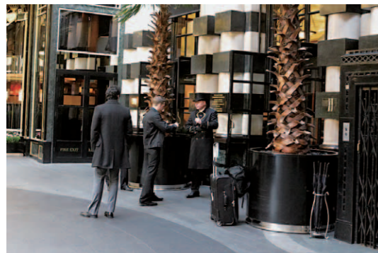
正面エントランス。改修後はガラリと雰囲気モダンになっている