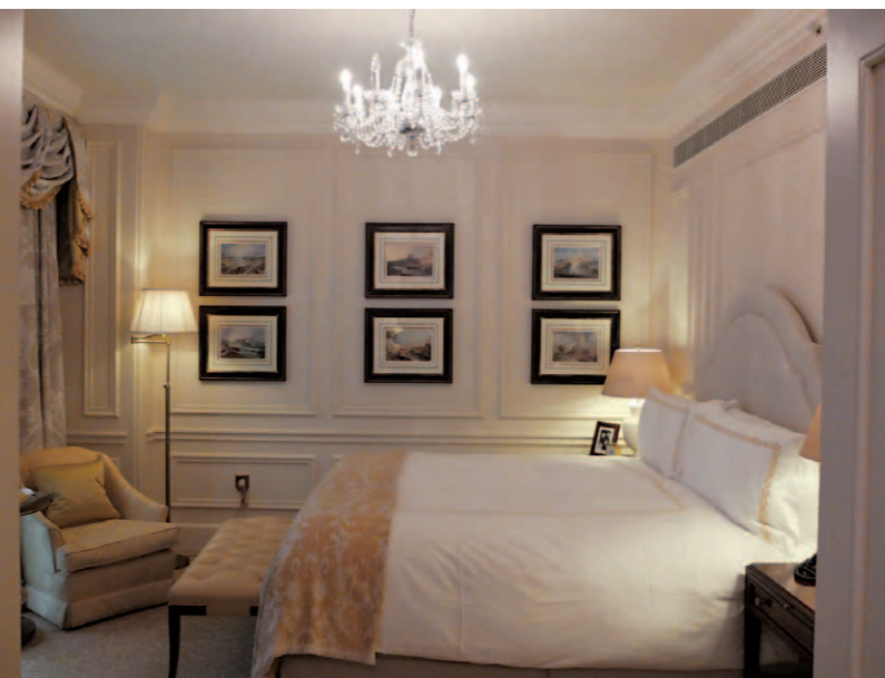
クラシカルなエドワード・スタイルのベッドルーム。この部屋はコートヤードにある寝室と居間が分かれたジュニアスイートで、約45㎡の広さがある