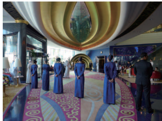
絢爛豪華なエントランスホール。この日は外国の要人を迎えるという事でスタッフが整列していた