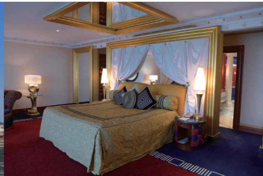
ゴールドが煌めく豪華なマスター・ベッドルーム。このスイートは「Deluxe Two Bedroom Suite」で、実に335㎡の広大な室内面積を持つ。セカンド・ベッドルームはツイン・タイプの仕様である