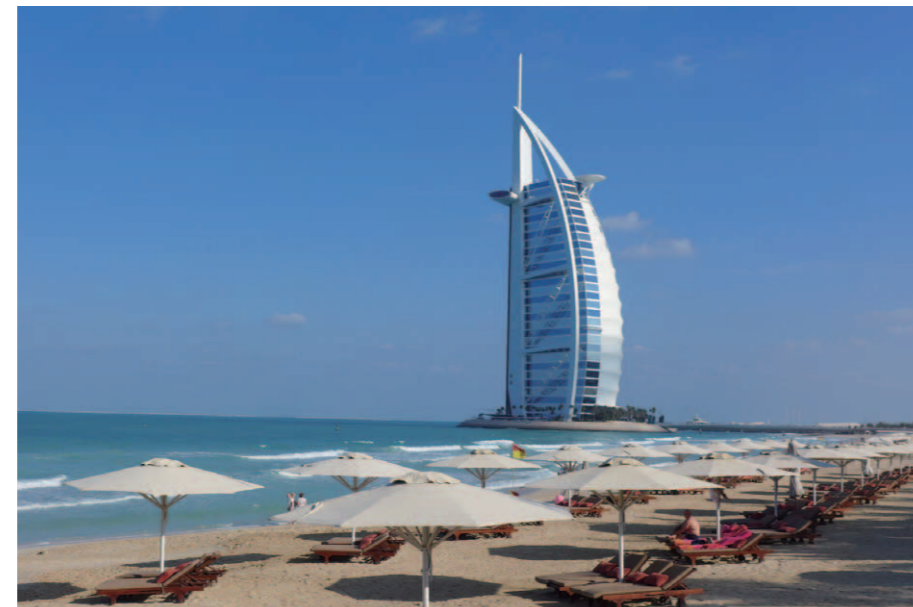
洋上に浮かぶ「アラブの塔」[Burj Al Arab]の雄姿。エッフェル塔を上回る321mの高さがあり、アラブの伝統的な「ダウ船」の帆をイメージした外観である