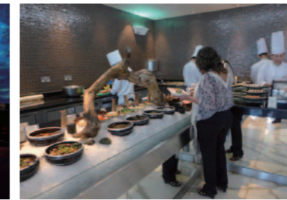
寿司やアジア系料理がカジュアル感覚で楽しめる日本料理の「Junsui」