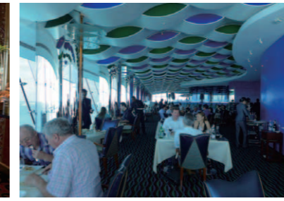
海上200mの眺望を誇る「Al Muntaha」。建物本体から突き出した形状の「天空のレストラン」だ