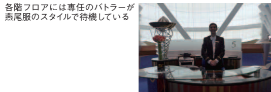
各階フロアには専任のバトラーが燕尾服のスタイルで待機している