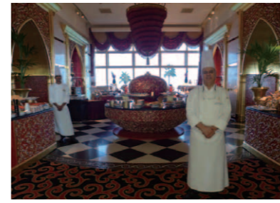
シェフが迎える地元アラブ料理の「Al Iwan」。階段状の噴水脇エスカレーターで上がったロビーフロアにある