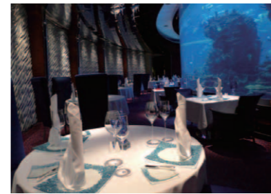
専用エレベーターで降り、海底気分が味わえる「Al Mahara」。幻想的な雰囲気ファインダイニングである