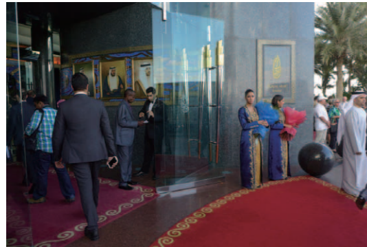
「Burj Al Arab」の正面エントランス。専用の連絡橋でセキュリティチェックを受けるため、宿泊客とレストラン予約客以外は入館できない