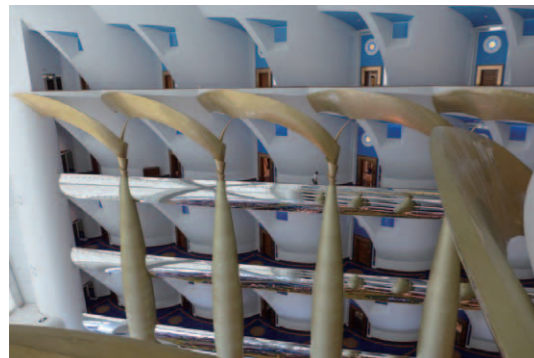
純金の金箔で仕上げた太い柱が何本も立つアトリウムの客室廊下部分。デュプレックス・スタイルのため各フロアは2階分の高さがある