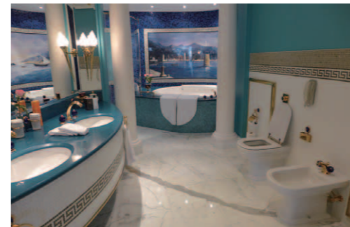
セカンド・ベッドルーム側のゴージャスなバスルーム。主寝室と同じ広さでこちらはブルーの彩色だ