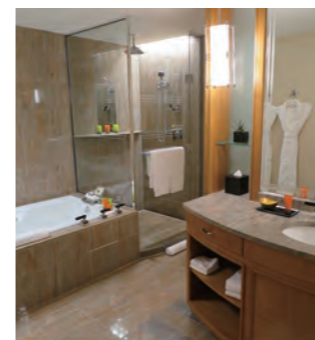
使い勝手がよいゴージャスなバスルーム