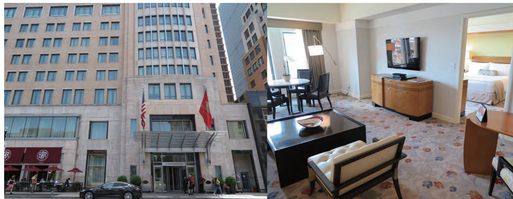
「Mandarin Oriental, Boston」は、ニューイングランドで唯一、AAA ファイブ ダイヤモンド賞と経済紙「フォーブス」のファイブスター賞の両方を獲得している実力派のホテルでもある