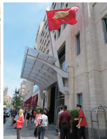
マンダリンの旗がたなびく「Mandarin Oriental, Boston」の正面エントランス