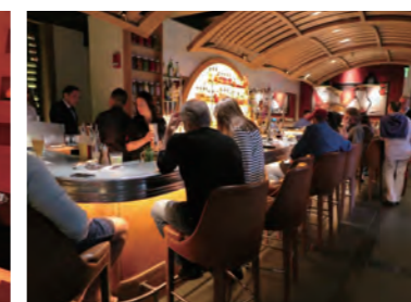
「Bar Boulud, Boston」はビストロ兼ワインバーで、バー・カウンターを含め、いつもにぎわいを見せている