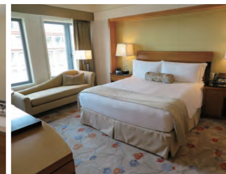
独立したベッドルーム。大型のカウチソファも面白い

マサチューセッツの州都ボストンはアメリカで最も古い歴史を誇る都市の一つである。どちらかと言えば保守的な気風のボストンに、まったく新しいコンテンポラリー・スタイルのホテルが誕生した。2008年にオープンした「Mandarin Oriental, Boston」(以下、MO/B)である。ニューイングランドで唯一、AAA ファイブ ダイヤモンド賞と経済紙「フォーブス」のファイブスター賞の両方を獲得している実力派のホテルでもある。現在、ボストンで最も魅力あるホテルとして、メディアや地元の富裕層の間で高い評価を得ている。