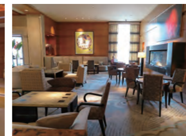
落ち着いたロビーラウンジ。赤々と燃えるファイアープレイスが印象的だ