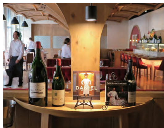
ロンドンやニューヨークの3つ星レストラン「ダニエル」の姉妹店としてオープンした「Bar Boulud, Boston」