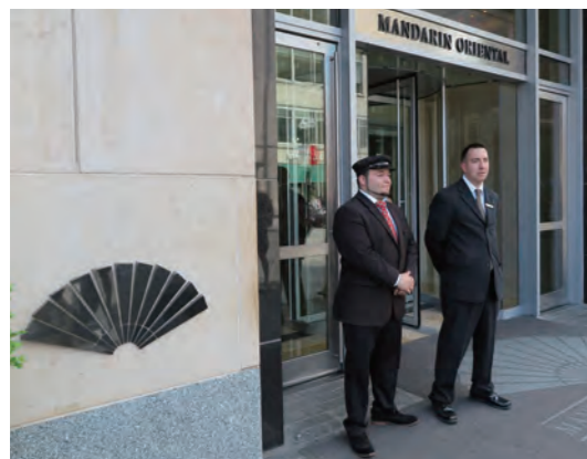
マンダリンのロゴマーク「扇」が掲げられた「Mandarin Oriental, Boston」の正面エントランス