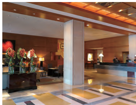
エントランスホールはシャープな直線を基本としたデザインで、落ち着いた上品な雰囲気だ