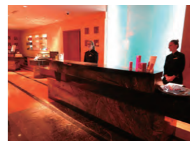
広さ 1500㎡を誇るラグジュアリースパ「The Spa at Mandarin Oriental, Boston」