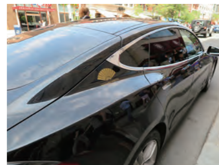
ロゴマーク「扇」が入った送迎用の電気自動車 (EV) 「テスラ」の最上級サルーン