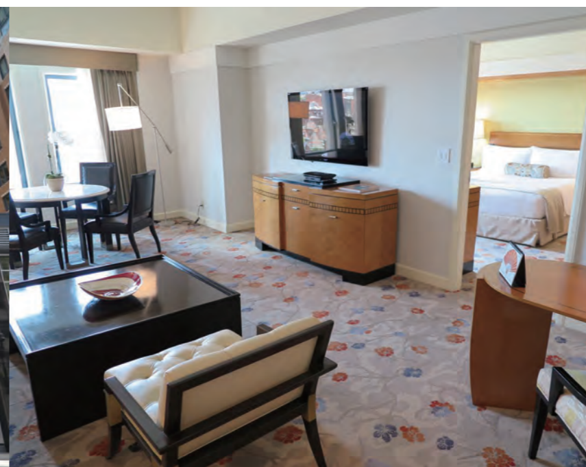
最新の設備を施した「Premier Suite」のリビングルーム。ベッドルームと合わせて約 100㎡の面積を持ち、モダンで洗練されたスイートである