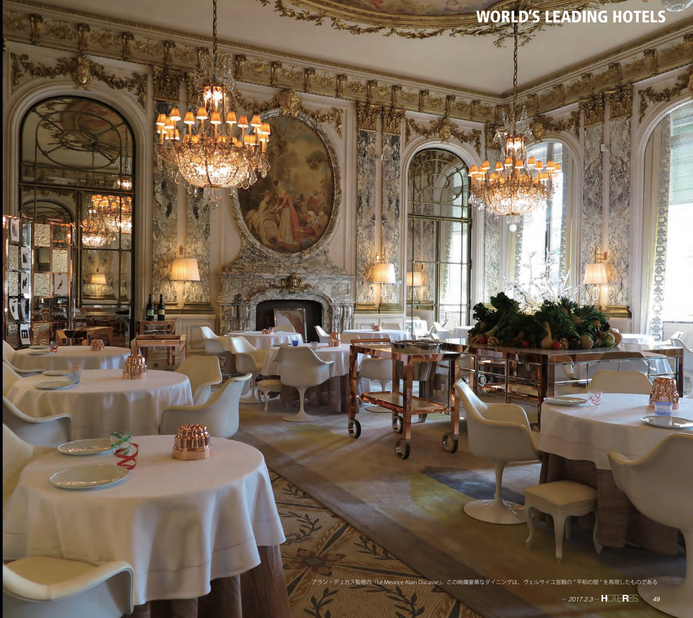
アラン・デュカス監修の「Le Meurice Alain Ducasse」。この絢爛豪華なダイニングは、ヴェルサイユ宮殿の“平和の間”を再現したものである