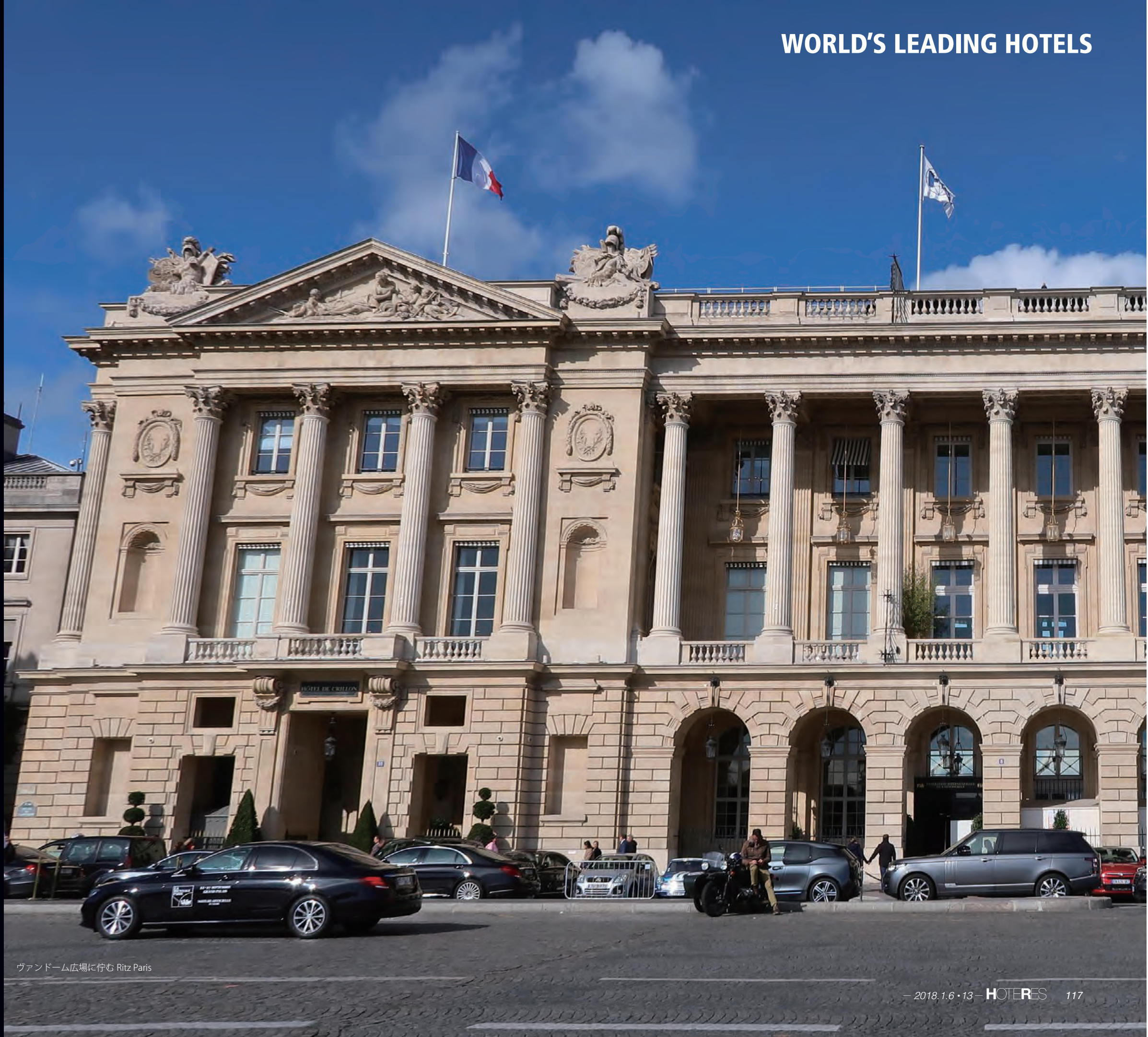
ヴァンドーム広場に佇む Ritz Paris